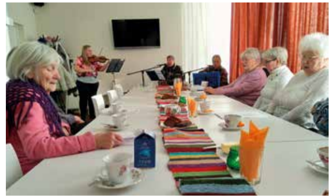
Päevakeskus on mõnus kooskäimise koht eakamale rahvale.

Võrrelda on keeruline, sest vana vallamaja oli nõuka ajal ehitatud elamuks, hiljem tegutses seal ka lasteaiad. Majas oli olnud mitu korterit ja seetõttu mitu eraldi sissekäiku. Vallavalitsuse elus tähendas see seda, et näiteks allkorruse ruumidest teisele korrusele raamatupidamisse minekuks oli vaja ühest uksest õue lipata ja siis teisest uksest