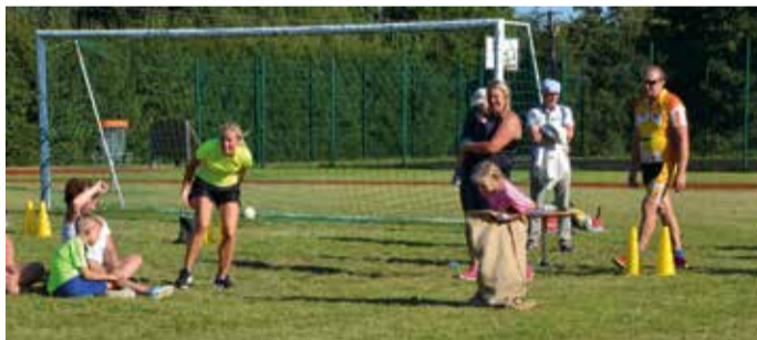
Kotijooksus saab alati palju nalja.