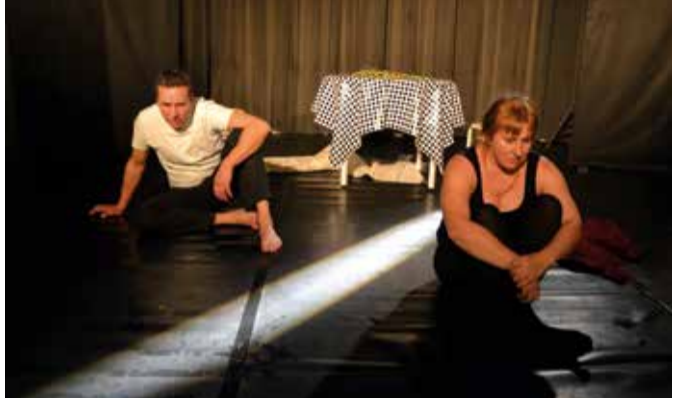
Klubi on näitelavaks esinejatele lähemalt ja kaugemalt.

jälle sisse. Talvel tuli teha parajaid piruette, kui kingadega mööda õue ja puutreppi liuglesime. Oli tavaline, et harjavarrega lakke koputades sai kiiremaid teateid edasi antud. Alumise korruse ruumid olid läbikäidavad, privaatsust oli vähe. Kui maja keskel toimus koosolek või istung, siis ühelt poolt teisele poole maja tuli läbi õue minna.