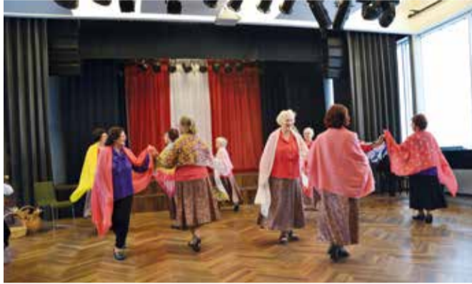
Tegevust jätkub majas kõigile.