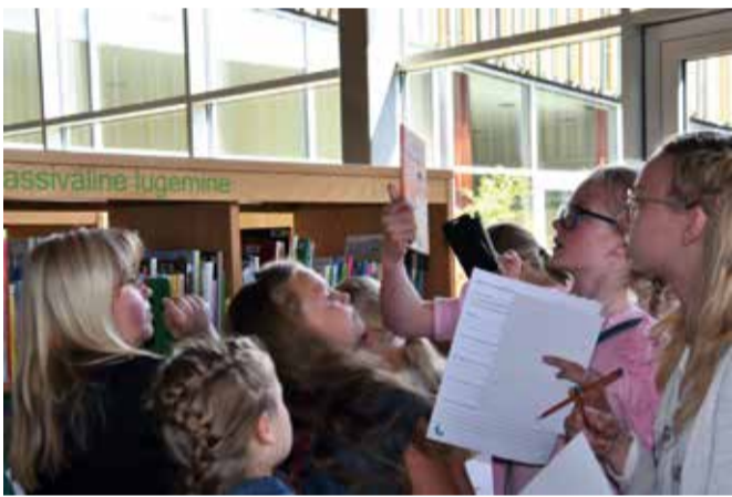
Mõnikord võib huvi raamatute vastu mitmekordistuda.

Lugejaskond Sõmerul on viimased aastad püsinud stabiilsena, aasta alguse seisuga oli lugejaid 561, neist 27% lapsed (võrdluseks – uude hoonesse kolides oli lugejaid 511).