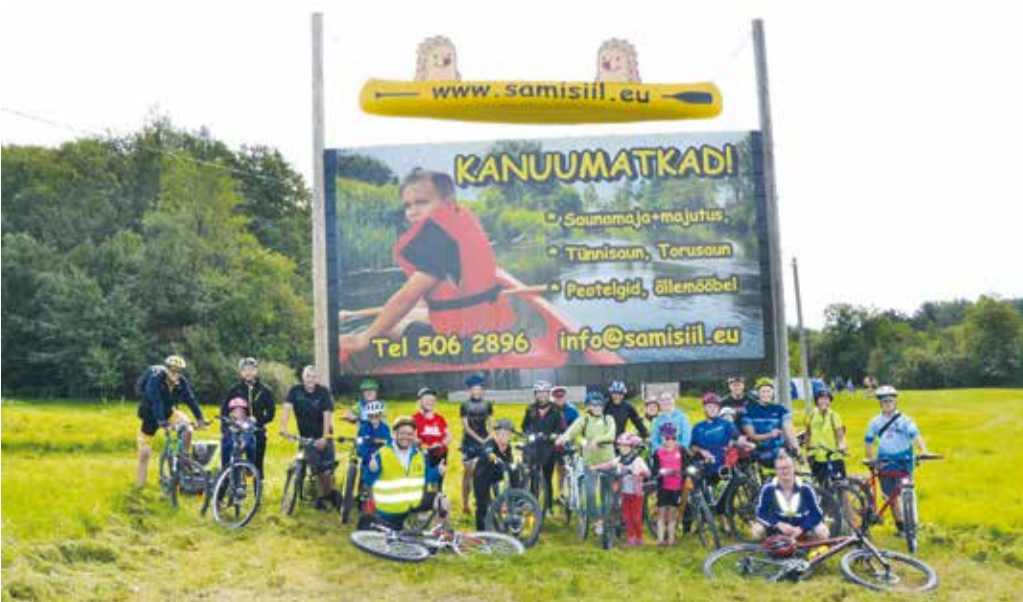
Matkajad Sõmeru Siilil külas.