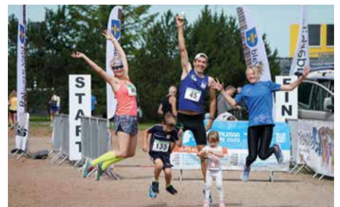
Sport võidab alati.