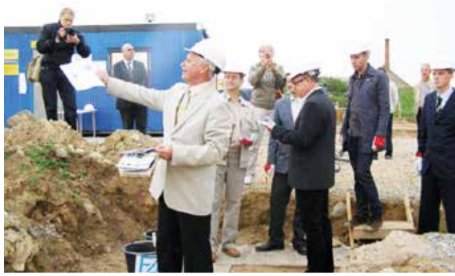
Nurgakivi ajakapslisse mahtusid muuhulgas ka sama päeva ajalehed ja ülevaade valla hetkeolukorrast.