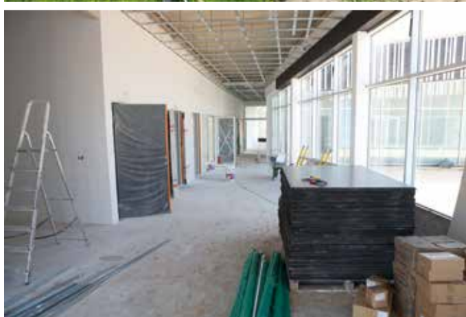
Unistused kerkivad – õdus fuajee ja valgusküllane raamatukogu hakkavad võtma ilmet.