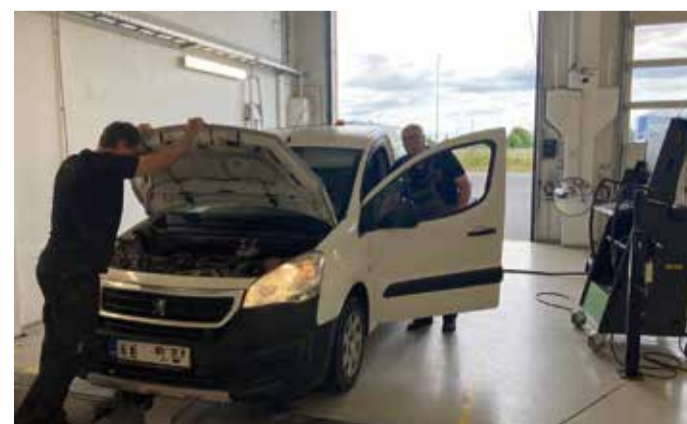
Kliendile peab teenus olema mugav.

Seatud nõudmised selekteerivad juba terad sõkaldest ja nii täituvad töökohad vaid