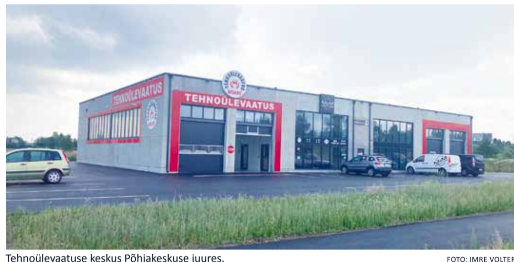
Tehnölevaatuse keskus Põhjakeskuse juures.