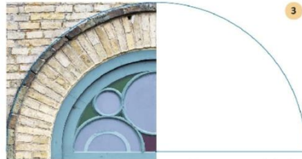
Välimise- ja sisemise peaukse kaaraknad