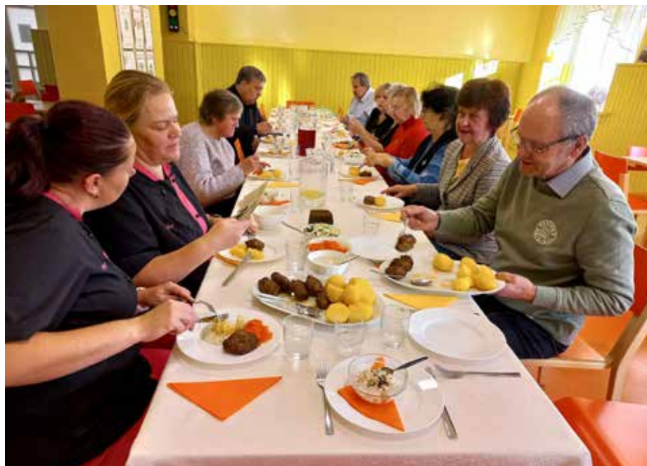
Sünnipäeva tähistati piduliku lõunasöögiga ühise laua taga.