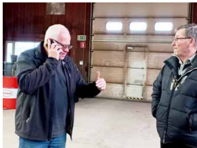
Ettevõtjal on kiirel ajal telefon punane.