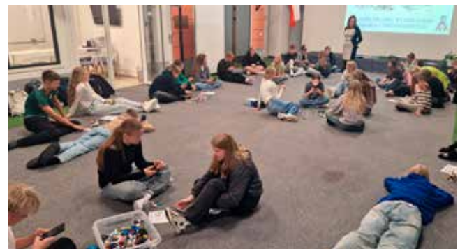
Ettevõtlikud noored koolitusel märkmeid tegemas.