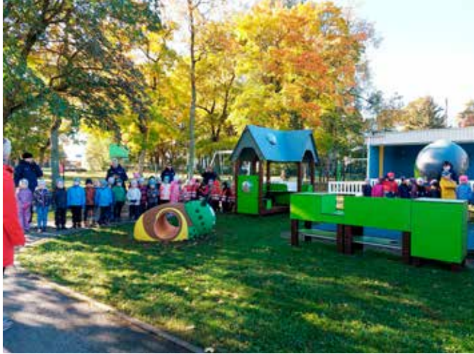
Mänguväljaku avamine Sõmerul.

Lasteaia Pääsusilm Sõmeru õppekoht avas oktoobri alguses uue mänguväljaku. Lasteaia hoovialal ja pargis on kokku 24 uut atraktsiooni. Ehitas Tiptiptap OÜ ja omanikujärevalvet tegi Trekolen OÜ.