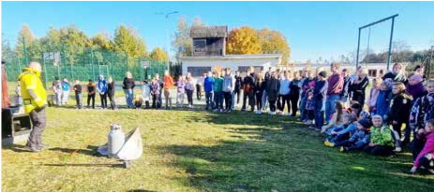
Koolipere sai teadmisi tuleohutusest.