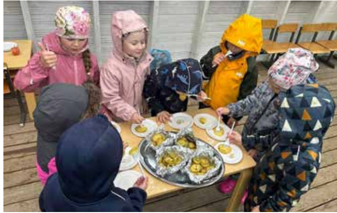
Veltsis grillil küpsetatud kartulid maitsevad suurepäraselt.

Veltsi õppekoha lapsed koos õpetajatega küpsetasid enda kasvatatud ja korjatud kartuleid. Või ja tilliga maitsestatud küpsed kartulid said lastelt heakskiidu. Kõik nautisid õues olemist ja väike vihmasabin ei heidutanud kedagi.