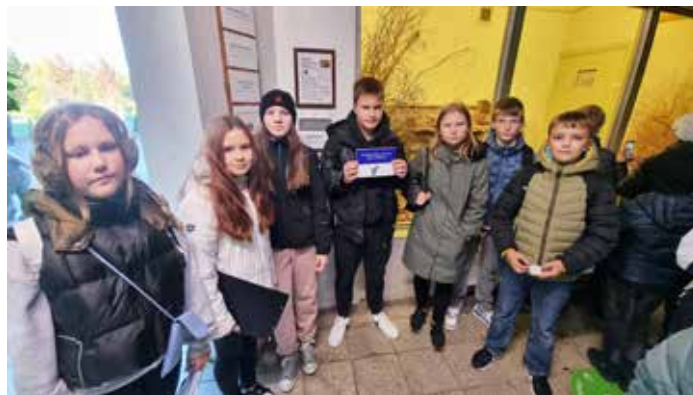
Kool on vaderiks loomaia surikaadile.

Terve nädal oli väga sportlik ja ettevõtlik. Nädal algul toimus politseinä-