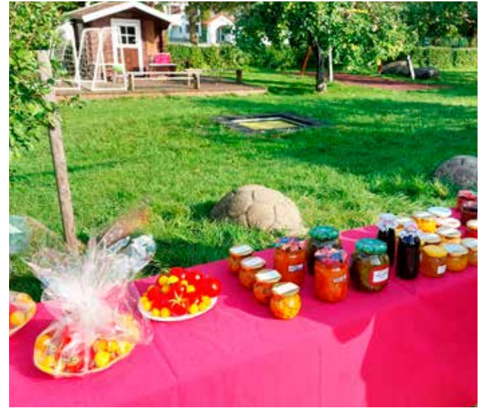
Ühe euro sügislaad Uhtnas.