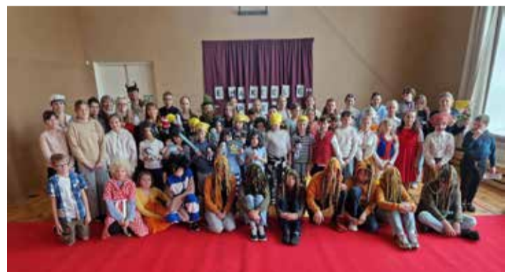
Uhtna kooli raamatumetsas seiklejad.