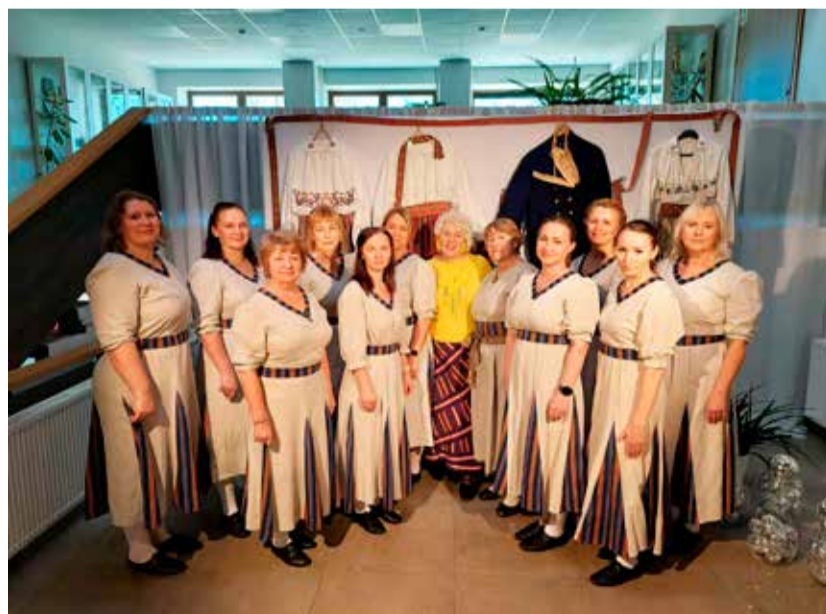
Juurte juurde jääv Uhtna Tantsumaia.

Siin see on – 196 aastat hiljem Tantsumaia pilgu