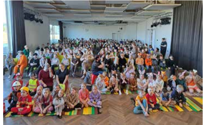
Sõmeru ja Näpi kooli ning lasteaed Pääsusilm ühiskohtumine.

Kuigi ametlikult tõmmati raamatuaastale joon alla, siis lepiti kokku, et meie vallas on iga aasta raamatuaasta, sest lugemine loeb ja, et meil sõnapuu tühjaksamist karta ei ole.