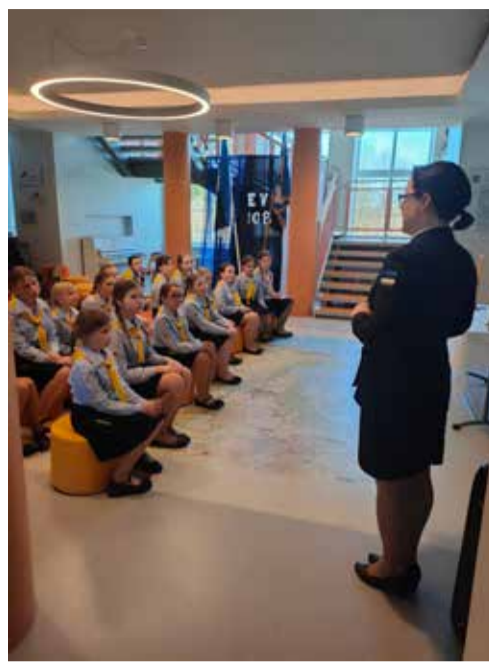
Pidulik koondus 24. veebruaril.

Pärastlõunal jätkati lugude animeerimisega. Loovtöö arendas planeerimis- oskust, püsivust ja koos-