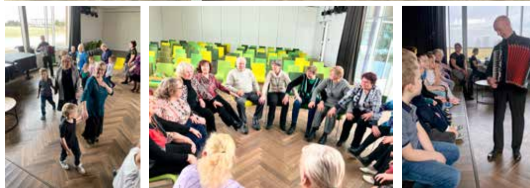
Omaparvelindude kohtumine Sõmeru lasteaialastega.