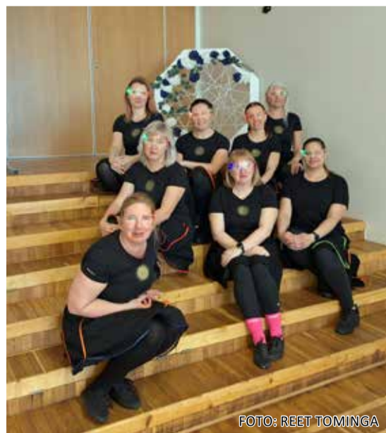
Tulevikku vaatavad Sõmeru Sõsarad.

Erinevate teemakäsitluste kõrval jõudis publikuni ka Sõmeru Sõsarate tantsusõnum, millesse oli pikitud tulevikku tarbeks põnev kostüümilahendus ja AI muusi-