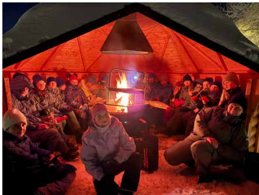
Lõkkeõhtu Kunda jõe kaldal grillmajakeses 22. veebruaril.

Laager algas kogunemise ja ohutuseeskirjadega tutvumisega. See lõi selge struktuuri ja turvalise raami kogu sündmusele. Edasi suunati fookus kodukohale: tutvuti Uhtnaga seotud lugudega, valiti välja sobivad